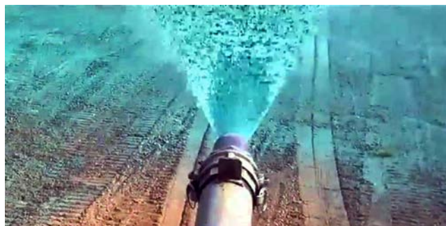
Green PAM (color) aplikowany hydrosiewem z mulczem celulozowym.