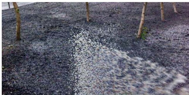
Green PAM aplikowany hydrosiewem z mulczem celulozowym.

* Uwaga - nie przekraczać dawki 4 opakowań na 600 gal. (~2.000l) - duża lepkość zawiesiny może zablokować hydrosiewnik.